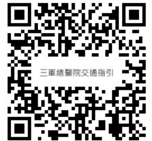
三軍總醫院交通指引

交通連結： https://www.tsgh.ndmctsg.edu.tw/unit/102321/26950