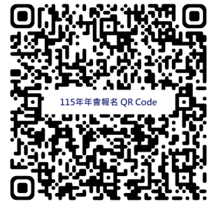
115年年會報名 QR Code

2. 銀行轉帳方式：ATM 或網路銀行等跨行轉帳，手續費各家銀行規定不同，需自行負擔；需於出席報名表單內正確填寫轉帳後 5 碼，否則將造成無法對帳，請會員留意自身權益。郵局代碼：700 轉入帳號：7000010-18798427